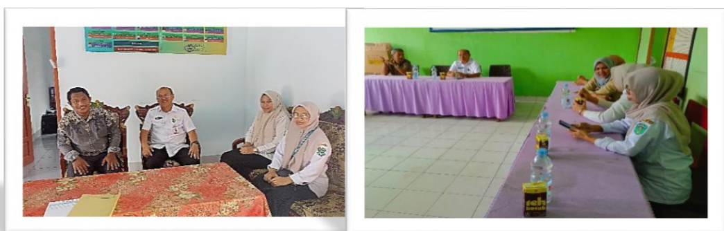
Dokumentasi : Kegiatan Sosialisasi dan Pendataan Siswa/Siswi Kegiatan Pelatihan dan Pembinaan Karakter Kebangsaan