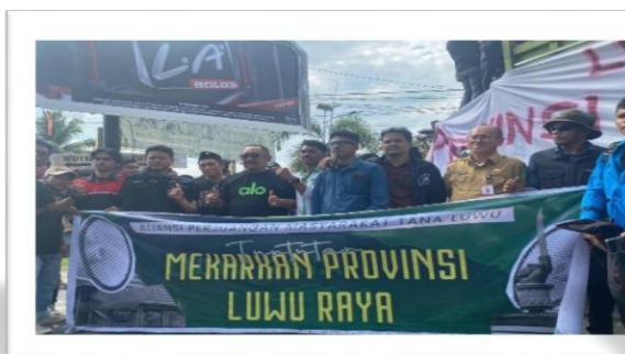
Dokumentasi : Kegiatan Pemantauan