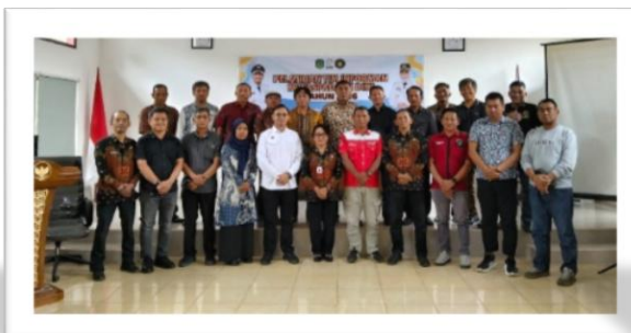
Dokumentasi : Pelatihan Tim Informan