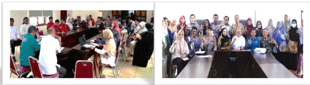
Dokumentasi : Rapat Pendahuluan Pembukaan Seleksi Paskibraka Tahun 2026